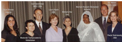
Foto de recuerdo de la ceremonia de los "Premios a la Democracia" de la NED de 2002 (Washington, 9 de julio de 2002)

Y aquí está la foto oficial de NED que inmortaliza el evento: