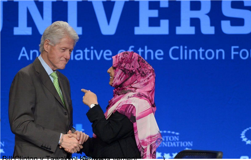
Bill Clinton y Tawakkol Karman en un momento de la conferencia )