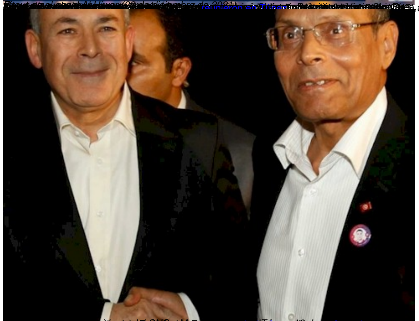
Amigos del pueblo sí se unen al CAS El CAS y el 45 aniversario de la Tíuna El CAS y el 45 aniversario de la Tíuna