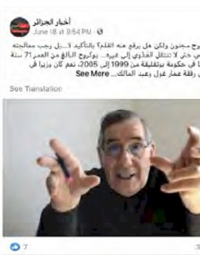
Screenshots showing the coordinated posting of an attack depicting opposition figure Nouredine Boukrouh as "crazy" shortly after he criticized Tebboune.