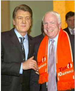
Viktor Yushchenko e John McCain (Kiev, febbraio 2005) Rivoluzione arancione (Ucraina)

Prima di tutto, iniziamo con l'Istituto Repubblicano Internazionale (IRI). Questa componente della NED era guidata dal defunto senatore John McCain (1936 - 2018). Questo bellicoso senatore è stato personalmente molto coinvolto nelle colorate rivoluzioni, ma anche nell'Euromaidan (Ucraina) e nella "primavera" araba. Fu un fervente seguace della "lotta non violenta" teorizzata dal filosofo americano Gene Sharp (1928 - 2018) e resa popolare dai serbi di CANVAS.