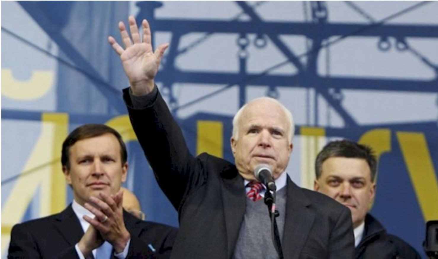
John Mc Cain (Kiev, 15 dicembre 2013) Euromaidan (Ucraina)

E che cosa ha offerto l'IRI al nostro Hirak? 200.000 dollari per "sostenere i democratici algerini nella loro partecipazione attiva alla transizione politica in corso".