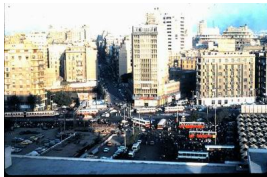
Place Tahrir (1983)

D'un banal et assez quelconque lieu continuellement bondé d'autobus et de vendeurs en tous genres, la place Tahrir s'est métamorphosée, l'espace d'un « printemps » hivernal, en épice de l'effervescence sociale « démocratisante » de l'Égypte.