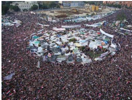
Place Tahrir (2011)

Les différentes manifestations populaires qui s'y sont déroulées début 2011 ont démontré que l'idéologie de résistance non violente, théorisée par Gene Sharp, jumelée à une application pratique des concepts acquise grâce aux formations du « Center for Applied Non Violent Action and Strategies » (CANVAS, Belgrade) est d'une redoutable efficacité dans la déstabilisation des régimes autocratiques [1]. Les jeunes cyberactivistes et militants « pro-démocratie » égyptiens formés par des organismes d'« exportation » de la démocratie (en particulier américains) ont su efficacement combiner la puissance des réseaux sociaux dans la mobilisation des foules dans l'espace virtuel et l'application stricte, dans l'espace réel, des « méthodes d'action non violente » clairement établies par CANVAS. Le président Moubarak en a fait les frais : il a été chassé par les « révoltés » de la place Tahrir après trois décennies de pouvoir sans partage. Gene Sharp a lui-même déclaré qu'il était particulièrement fier de ce que les cyberdissidents égyptiens avaient réalisé [2].