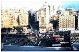
Place Tahrir (1983)

D'un banal et assez quelconque lieu continuellement bondé d'autobus et de vendeurs en tous genres, la place Tahrir s'est métamorphosée, l'espace d'un « printemps » hivernal, en épice de l'effervescence sociale « démocratisante » de l'Égypte.